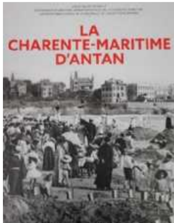
Le département au début du siècle. REPRODUCTION « SO »

L'ouvrage est construit en sept chapitres qui explorent la vie agricole, les petits métiers, l'industrie et le commerce, les activités maritimes, les grandes villes, la vie quotidienne, les cérémonies, les fêtes et les traditions et la naissance des loisirs. Accompagné des textes de Pairault, ce trésor d'images raconte la belle époque et dessine un territoire tout à la fois pro-