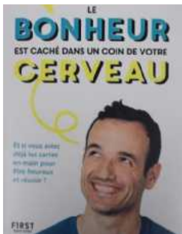
Olicard, showman, magicien et mentaliste. REPRODUCTION « SO »

Suivi sur ses journées les plus prolifiques par plus de 3 millions de personnes sur sa chaîne YouTube, il enchaîne également depuis plusieurs années les succès d'édition. Après son premier ouvrage, « Votre cerveau est extraordinaire » vendu à 140 000 exemplaires ou « Votre temps est infini », son dernier livre va faire du bien en ces temps de Covid : « Le bonheur est caché dans un coin de votre cerveau ». Celui qui s'est également autoproduit en 2018 sur la scène parisienne de l'Olympia y raconte de manière aussi décomplexée que ludique les « ressources puissances de notre cerveau ». « Commencez par le décontaminer pour entrevoir une nouvelle réalité et découvrez les dix cachettes de vo-